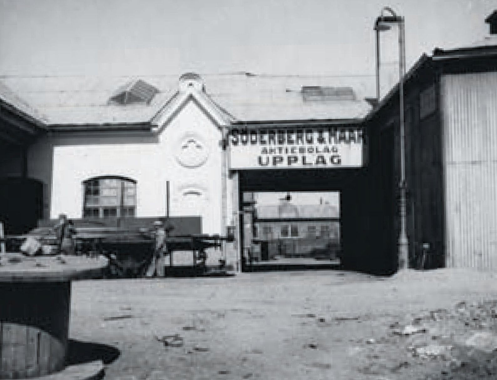
Ett av de viktigaste företagen på Liljeholmen var Söderberg & Haak, som från 1920 hade ett upplag för järn och stål i Mariefors, med tiden omfattande 60.000 kvadratmeter.