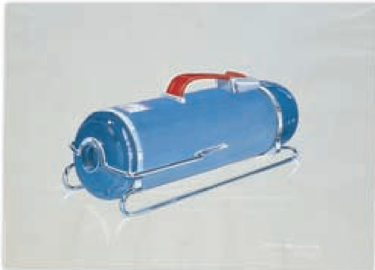
Designförslag till dammsugarmodell för mindre hushåll utförd av Sixten Sason 1943. Modellen kom i produktion 1948 och i reklamen riktade man sig till unga ensamstående med självhushåll som saknade hemhjälp.