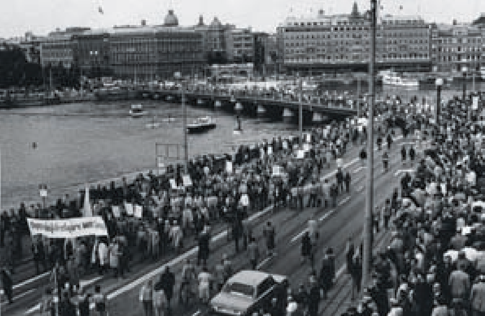
Den 4/12 1993 protesterade hela 125 000 personer mot löntagarfonderna i en av de största demonstrationerna i Sveriges historia. Det är dock en förenkling att säga att det var fonderna som ledde till den svenska modellens upplösning.