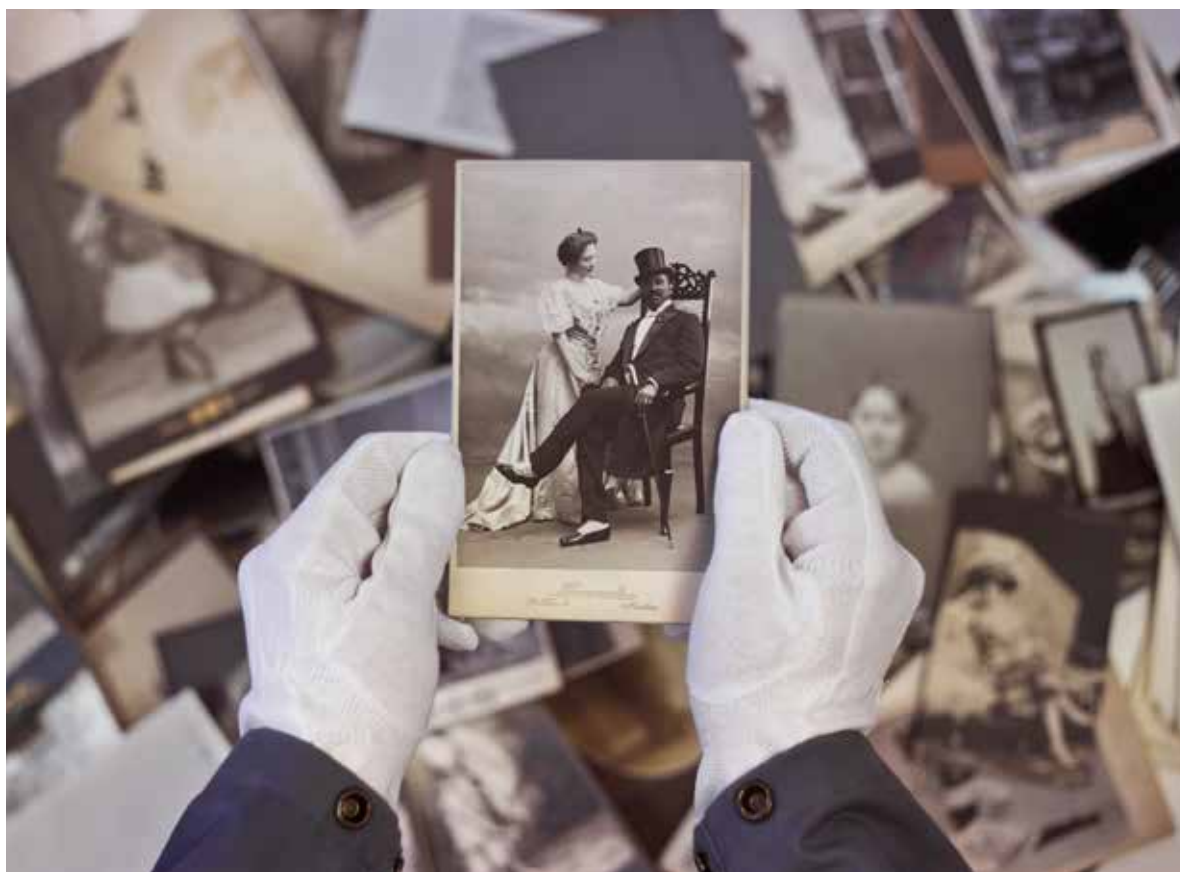
Bild och film - levandegör företagshistoriska ögonblick

Ett ögonblick kan förändra allt. Ett fotografi eller ett filmklipp är ovärderligt i engagerande berättelser om företagets utveckling. Använd ditt företags bildminnen i varumärkestödjande historieberättelser som griper tag i mottagarna.