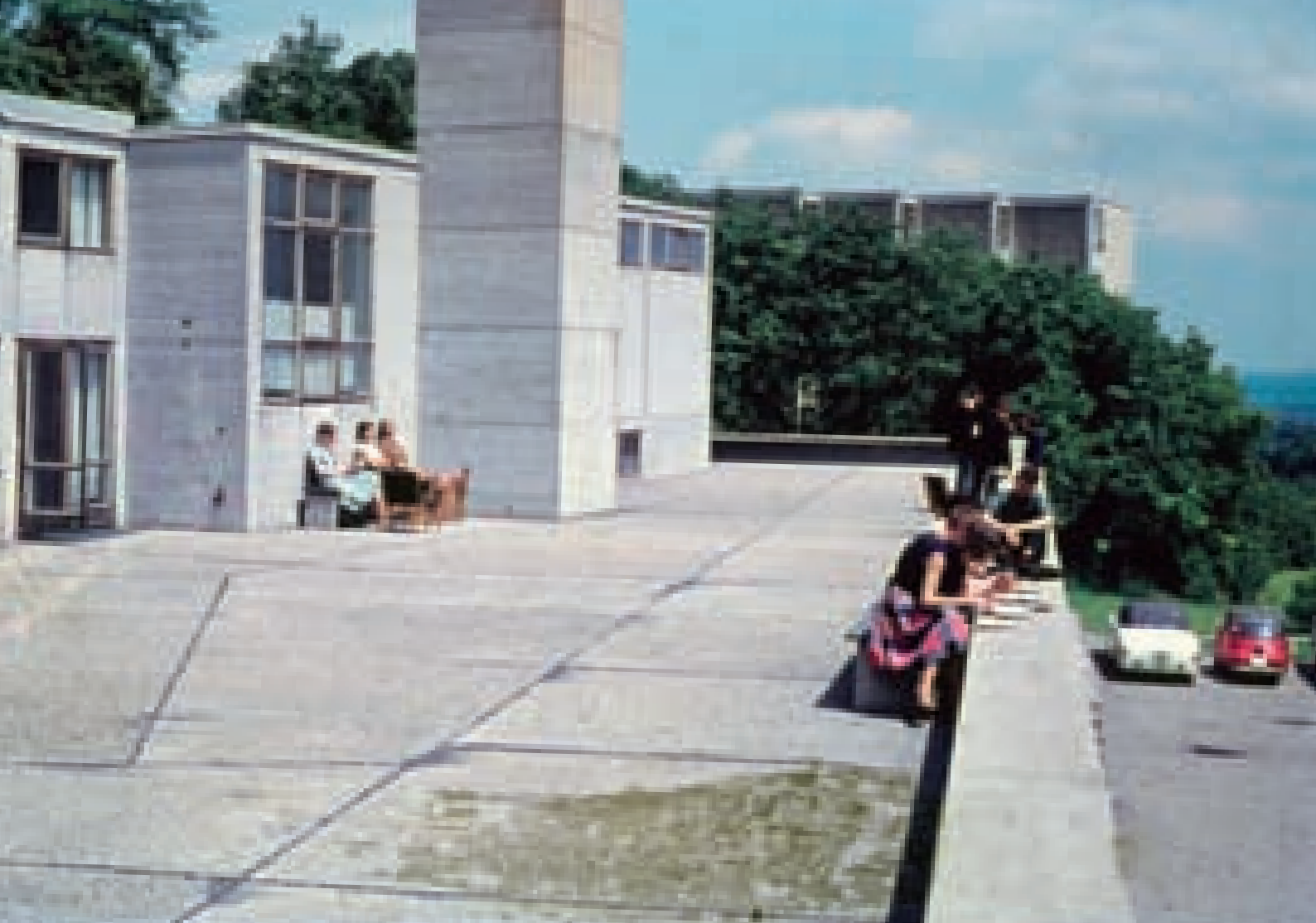
Studenter som passar på att njuta av solen på en av de terrasser som fanns på Hochschule für Gestaltung's nya skolbyggnad i Ulm. Byggnaden stod klar 1955 och låg uppe på berget Kubberg. Från terrasserna hade man en magnifik utsikt över hela staden Ulm.

Den andra inriktningen var presentation. Detta ämne bestod av konstruktionsritning, skrift, språk och fri teckning. Därefter följde metodikövningar kring matematik, logik, kombinatorik och topologi. Den tredje inriktningen var sociologi och den fjärde var perception. I Gunnar Jonssons efterlämnade material finns 13 nummerade originalövningar, utförda av honom.